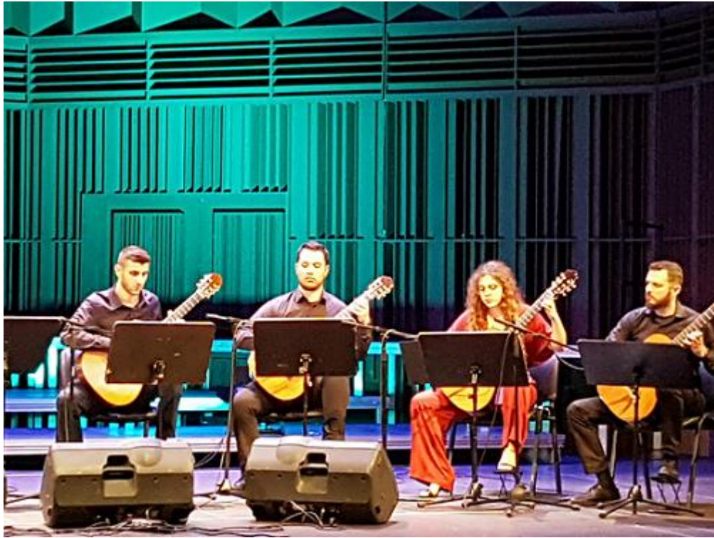
Η μαγεία της κιθάρας στο Εθνικό Αρχαιολογικό Μουσείο με το βραβευμένο Κιθαριστικό Σύνολο Νίκαιας του Συλλόγου Ελλήνων Κιθαριστών.