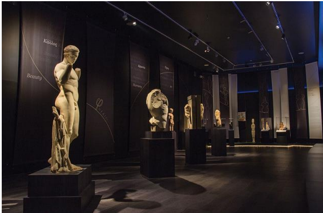
Οι αμέτρητες όψεις του Ωραίου υπό το φως της πανσελήνου στο Εθνικό Αρχαιολογικό Μουσείο (© Εθνικό Αρχαιολογικό Μουσείο/ΤΑΠ, φωτογράφος Στέλιος Σκουρλής).